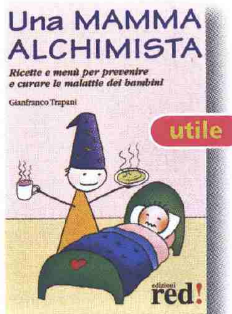
Una mamma alchimista G. Trapani; Red Edizioni, pag. 240 - 14,50 euro

A cquistando questo dvd, si partecipa al progetto Unicef "Uniti per i bambini, uniti contro l'Aids", che combatte la diffusione della malattia nei Paesi più poveri. A dare la voce ai personaggi di una straordinaria storia animata, tratta da un racconto di Bianca Pitzorno, ci sono molti personaggi noti, come Lino Banfi, Francesco Totti e Paolo Maldini.