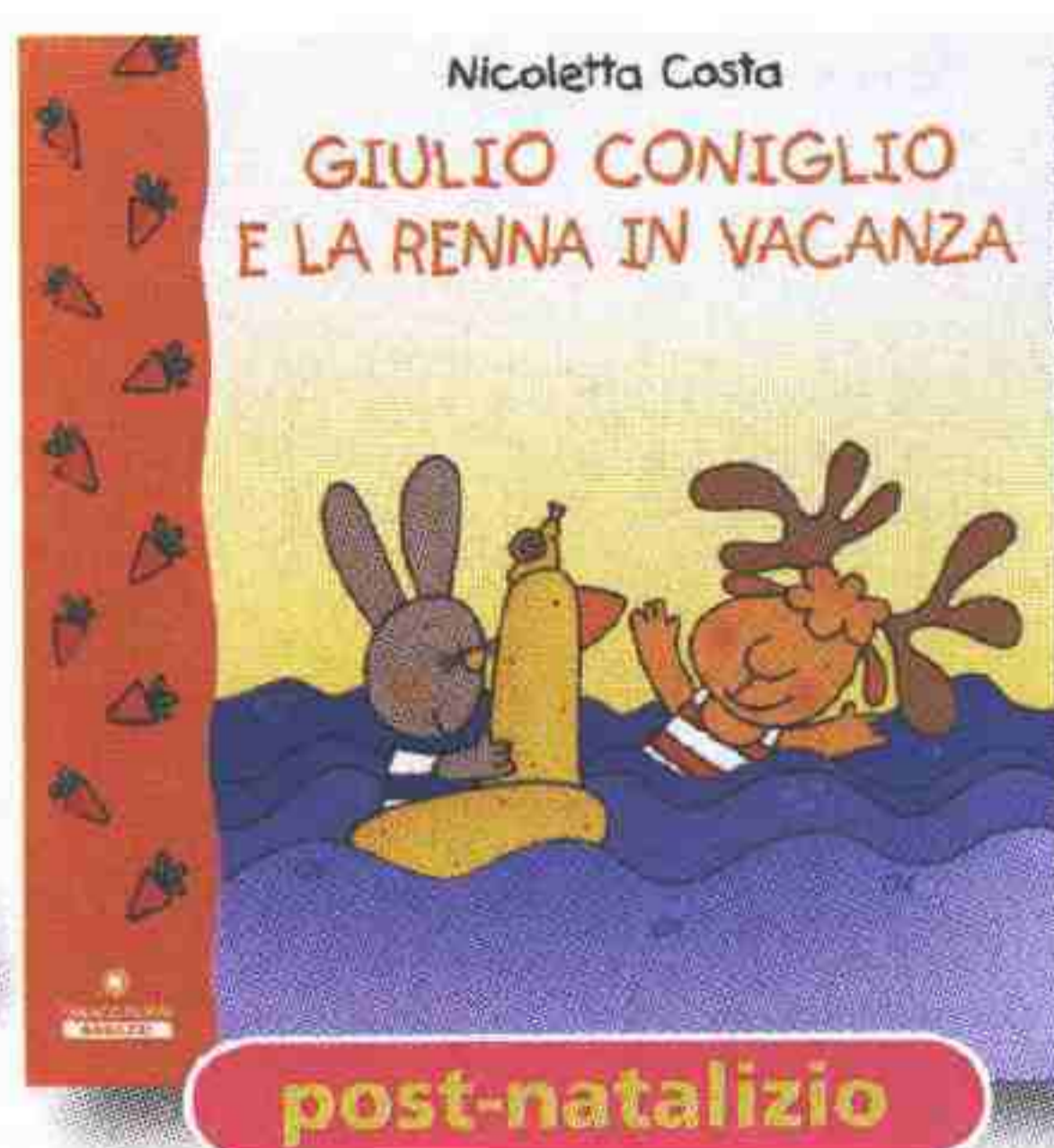
Giulio Coniglio e la renna in vacanza N. Costa; Franco Panini Ragazzi, pag. 32 - 6,50 euro

R accoglie ricette appetitose e divertenti questo libro dedicato ai bambini. A loro spetta il compito di realizzare, magari con l'aiuto di un adulto, piatti gustosi e sani al tempo stesso, per ritrovare il piacere di cucinare insieme in famiglia. Il divertimento è poi assicurato dall'abbinamento di ogni ricetta con un personaggio Disney, come Topolino, Mulan e i Monsters. Per i più grandicelli.