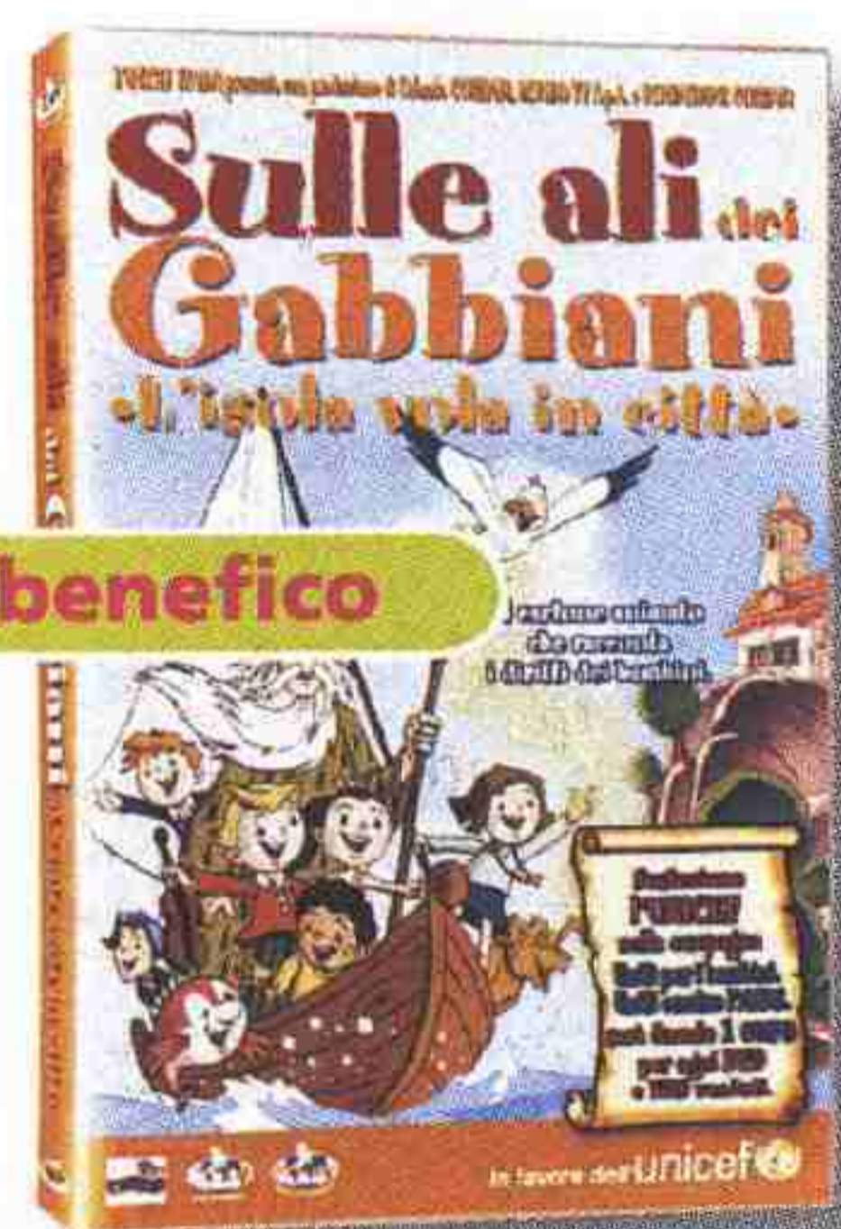
Sulle ali dei Gabbiani Mondo Home Entertainment, Dvd da 60 min. circa. - 5,00 euro

I bambini serbano un ricordo di quando si trovavano nel pancione: è questa l'ipotesi suggestiva posta dall'autore, ginecologo, nel corso di due studi scientifici. Il libro è una carrellata di frasi tenere, buffe e sorprendenti con le quali alcuni bimbi raccontano i lunghi mesi trascorsi in utero e lo straordinario momento della nascita.