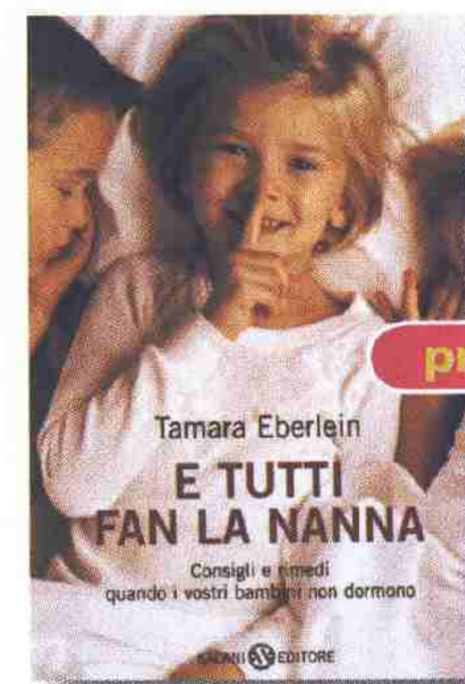
E tutti fan la nanna T. Eberlein; Salani Editore, pag. 188 - 12,00 euro

C hi non ha mai sognato di avere i poteri magici di una fata? Indossando le ali che accompagnano il volume, ogni bimba può divertirsi a realizzare qualche incantesimo. Basta leggere le avventure di Tatiana, una principessa delle fate giovane e inesperta, e imparare da lei a costruirsi una bacchetta magica per realizzare tutti i propri desideri... O quasi. Dai tre anni.