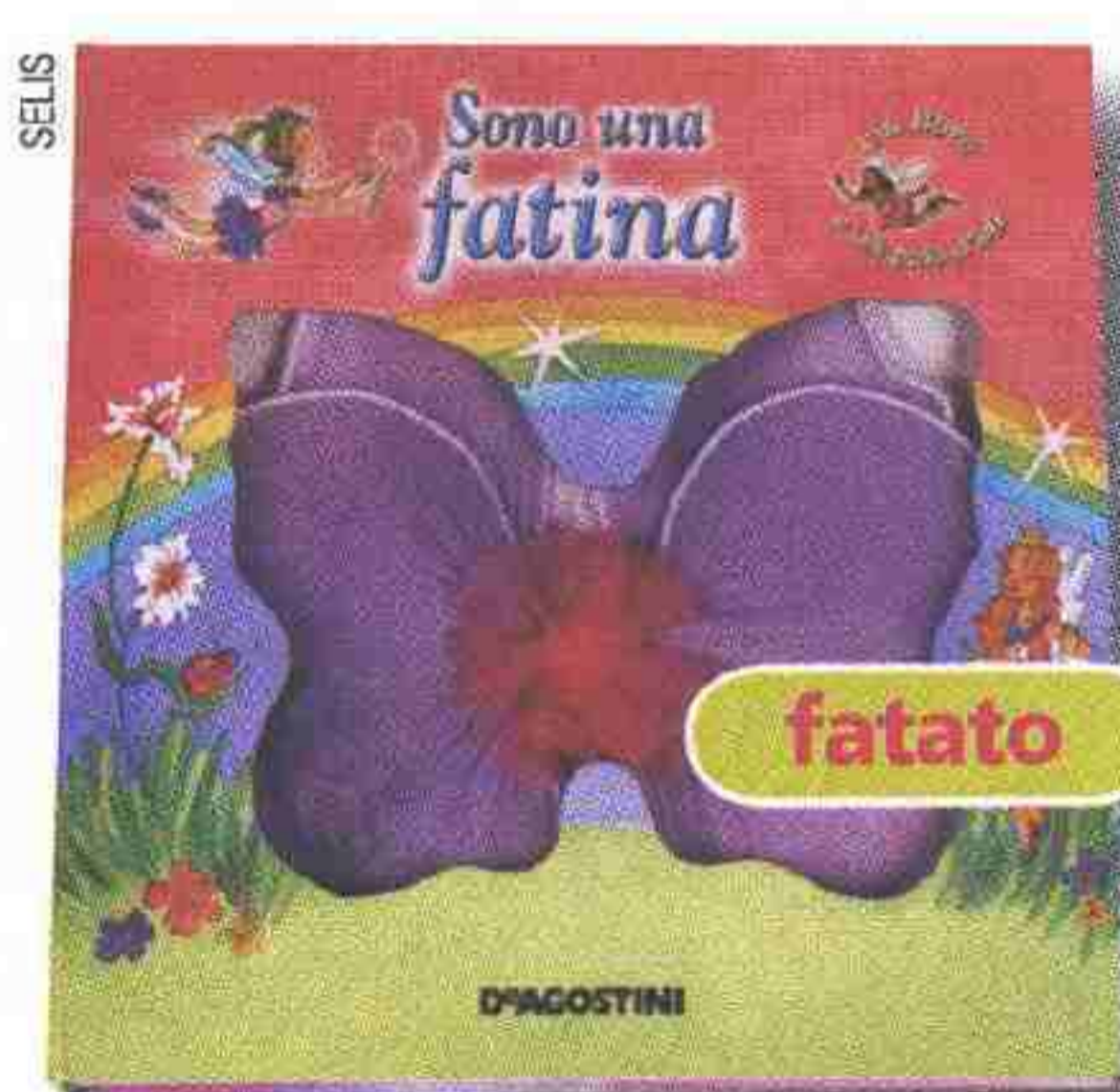
Sono una fatina De Agostini, pag. 24 - 11,90 euro

P revenire e curare con l'alimentazione le malattie dei bambini come allergie e infezioni, è possibile, perché una dieta corretta consente di evitare molti disturbi e pone l'organismo in condizione di esprimere al meglio le sue potenzialità. Il libro si rivolge agli adulti, soprattutto alle mamme che, con le loro sapienti "alchimie" in cucina, possono instaurare le giuste abitudini alimentari per i piccoli.