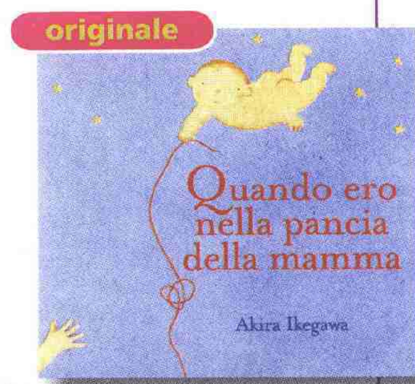
Quando ero nella pancia della mamma A. Ikegawa; Cairo Editore, pag. 80 - 10,00 euro

S in da neonati, i bambini si esprimono con la mimica dei loro volti e con tutto il corpo, aspettandosi di essere compresi dagli altri. Vi è quindi un repertorio di gesti, atteggiamenti e posture che utilizzano i piccoli per comunicare da bebè e nei primi anni di vita. Il libro insegna, anche con immagini esemplificative, a interpretare questo linguaggio del corpo.