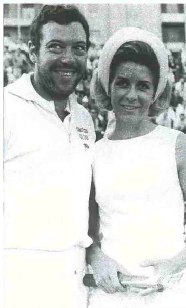
Sopra: Lea Pericoli e Nicola Pietrangeli . In alto, a sinistra: Enzo Ferrari nella veste di pilota. In basso, a sinistra: Josefa Idem durante una gara.