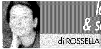
di ROSSELLA MARTINA

DOPO l'eccezionale esordio con "Palazzo Yacoubian" il dentista-scrittore del Cairo ripropone la formula corale in questo romanzo che parla della comunità egiziana a Chicago, in particolare di un gruppo di medici e studenti del dipartimento di Istologia dell'Università. Pur sempre apprezzabili, le vicende sono stavolta meno diversificate e ruotano attorno alla diffidenza degli americani nei confronti degli arabi, l'ostilità tra musulmani e copti, la nostalgia che mina anche la vita degli immigrati di successo.