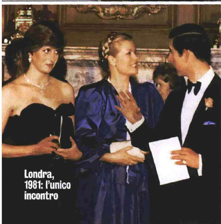
Londra, 1981: l'unico incontro

MILANO, maggio Grace e Diana - I destini gemelli di due principesse tra fiaba e tragedia (Cairo editore, in libreria dal 13 maggio) incrocia la vita della giovane Spencer, vergine andata in sposa all'erede al trono d'Inghilterra, e della regina di Hollywood, che abbandona per sempre il set per amore di Ranieri, sovrano di un minuscolo principato affacciato sul Mediterraneo. Vi proponiamo in anteprima il capitolo dei matrimoni reali.