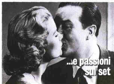
...e passioni sul set

AMORI IMPERFETTI A sin., Grace Kelly ritira l'Oscar nel 1955 per il film "La ragazza di campagna"; accanto a lei, il coprotagonista William Holden, uno dei partner di cui lei si innamorò, ricambiata; più a sin., nel 1955, con un abito di Oleg Cassini, un altro dei suoi amori; a lato, con Ray Milland, con lei in "Delitto perfetto" (1954).