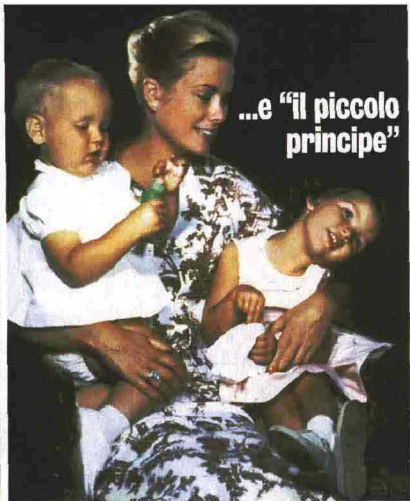
...e "il piccolo principe"

GLI AMATISSIMI FIGLI Sopra, Diana con William, nato nel 1982, e Harry, del 1984; a ds., Grace nel 1959 con la primogenita Carolina, oggi 53enne, e l'attuale principe regnante di Monaco, Sua Altezza Serenissima Alberto II, 52.