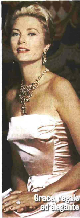
Grace, regale ed elegante