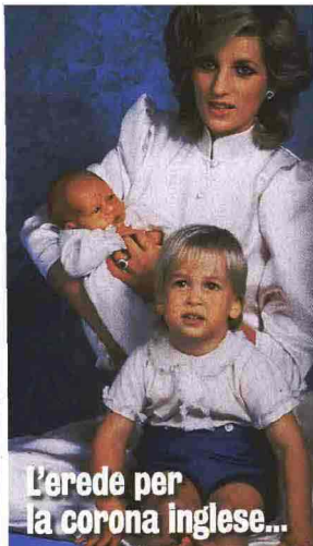
L'erede per la corona inglese...