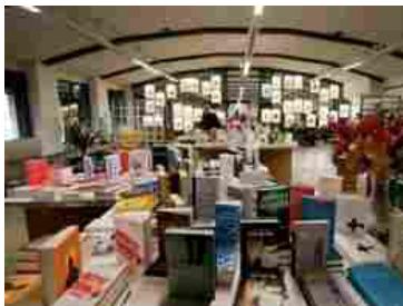
La sala Panoramica di Bookcity.