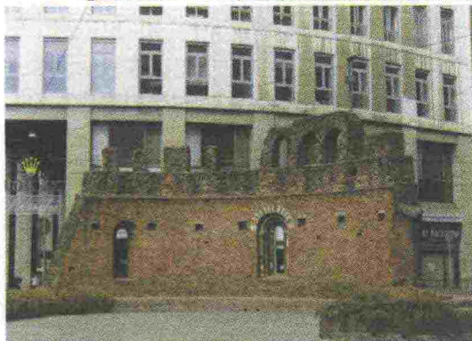
Ciò che resta dell'abside di San Giovanni in Conca in piazza Missori e un affresco della chiesa ora al Castello