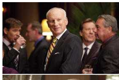
È morto James Rebhorn, caratterista di Independence...