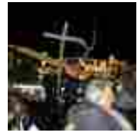
La croce, scandalo e inciampo di pace