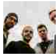
"QUELLO CHE NON DICO", il secondo singolo de IL REBUS estratto dal loro album d'esordio "A COSA STAI PENSANDO?"