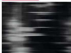
Matteo Castiglioni Supersuperficie , 2017, grafica digitale su vetro, cm 17x23.