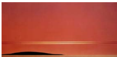
Ilaria Fasoli Studio Luce 19 , 2017, acrilico e olio su tela, cm 50x100.