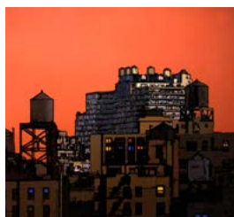
Francesco Nicolato Sei prono all'acqua! Che tu sia nero, bianco, ricco o povero , 2017, acrilico su tela, cm 100x100.