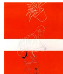
Mariano Domenico Russo Smart life , 2017, acrilico su tela, cm 120x100.