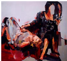
Evita Andújar Liquidi 8 o il passato si racconta , 2017, acrilico su tela, cm 95x105.