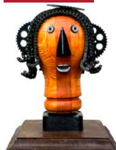
Giulio Barbieri Testa girevole , 2012, legno e ricambi di autovetture, h cm 40.