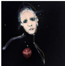
Francesca Candito Vai via da me , 2017, acrilico su tela con collage, cm 100x100.