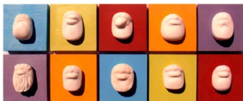
Marika Ricchi People , 2017, marmo bianco di Carrara su legno, cm 14,5x14,5 ciascuno.