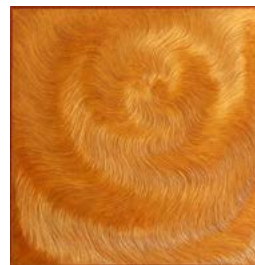
Antimo Bertolino Prendi il tuo tempo , 2016, legno MDF e acrilici, cm 100x100.