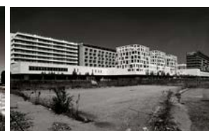
Stefano Barattini Cattedrali nel deserto 1, 2 e 3 , 2017, fotografie digitali, cm 35x50 ciascuna.