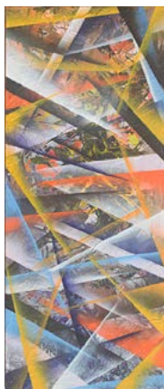
Alessandro Gerull Dall'alto al basso , 2017, tecnica mista, cm 120x50.