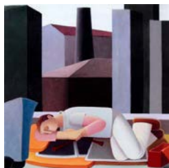
Domenico Lasala Il riposo del musicista errante , 2012, olio e acrilico su tela, cm 70x70.