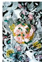
Giulia Ronchetti Clitennestra , 2016, china liquida, pastello e acrilico su tela, cm 120x80.