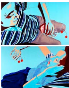
Savina Capecci Transgenic awakening , 2016, acrilico su tela, cm 120x100.