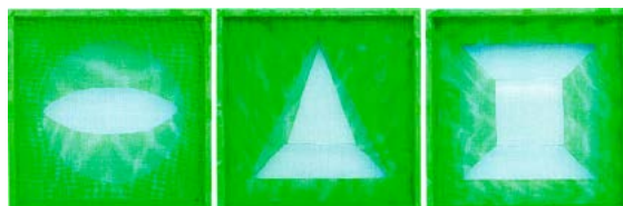
Mattia Ferretti Chroma key _geometria solida , 2017, acrilico e tagli su retino VTR, tritico, cm 30x30x6 ciascuno.