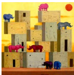
Giorgio Piovella 9 maggio 2016. Mercurio passa davanti al sole , 2016, acrilico su tela, cm 70x70.