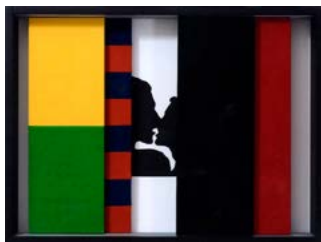
Sandro Tomassini Bacio nascosto , 2017, tecnica mista, cm 100x120.