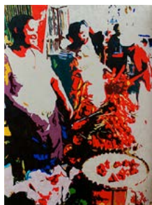
Daniela Zocca Divergenze parallele , 2017, acrilico e smalto su tessuto damascato, cm 120x90.