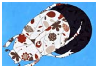
Angelo Fiore Geotrupes stercorarius