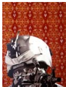
Antonella Ciccarone Spalle al muro!