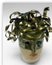
Lupo & Asso Medusa