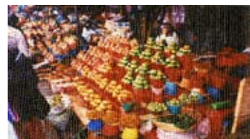
Monica Pozzi En plein air