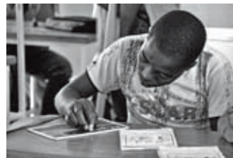
Giovanni Bonsignori Senza titolo