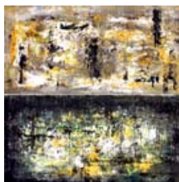
Paolo Ciabattini Rifrazioni contrapposte