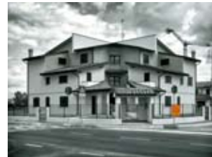
Giancarlo Zatti Storie di case