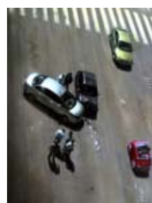
Filippo Lamanna On the road