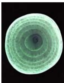
Eugenio Marchesi Sezioni (Cipolla)