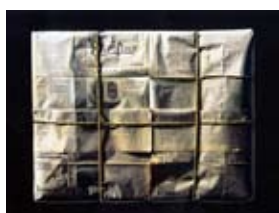
Francesca Gargano GRN - 005.10