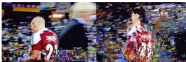
Claudio Orlandi Interference