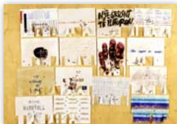
Graziano Dovichi Stato d'animo...