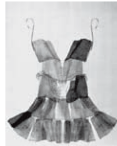
Eva Reguzzoni Vestimenti...